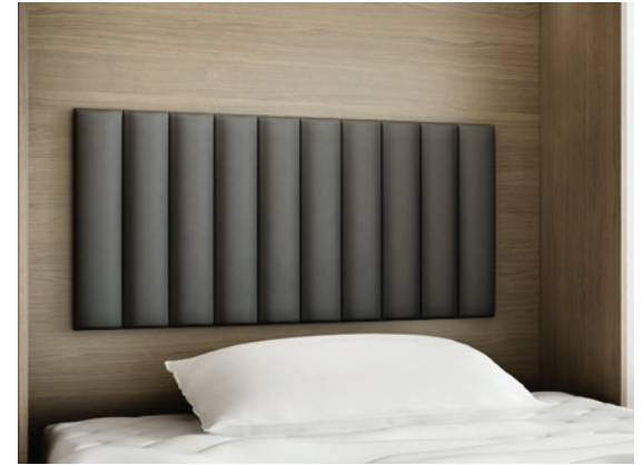
Bali - wezłowie tapicerowane