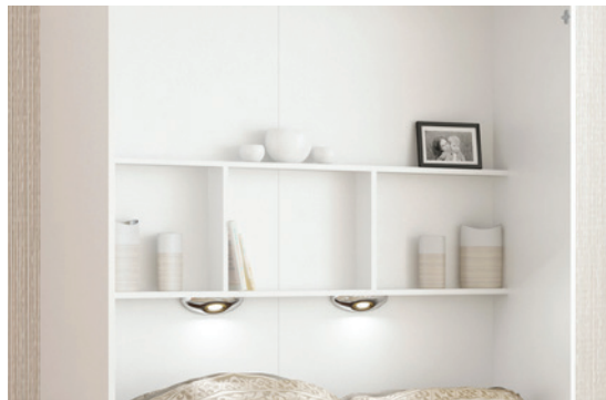
"H" - półka wewnętrzna