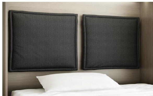
Quattro - wezglowie tapicerowane