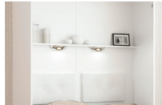
"I" - półka wewnętrzna