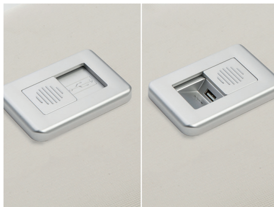
USB charger - Estetyczna ładowarka z odsuwającą kłapką