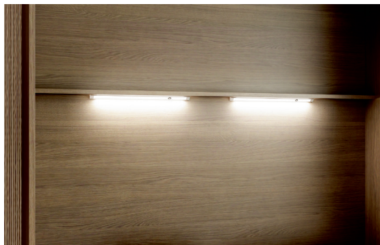
Led 40 - Dwie indywidualnie lampki kątowe z wmontowanym przełącznikiem oraz dimmerem. Obudowa: profil aluminiowy, pokrywa mleczna. LED montowany pionowo w narożnikach